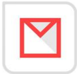
通过账号和邮箱 重置密码