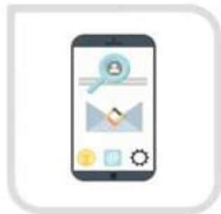
通过账号和手机验证码 重置密码